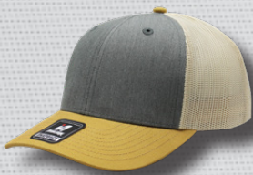
HEATHER GREY -MUSTARD-STONE