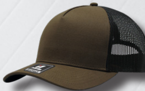
BROWN / BLACK