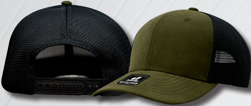
DK GREEN BLACK