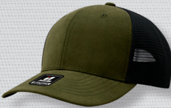
DK GREEN BLACK