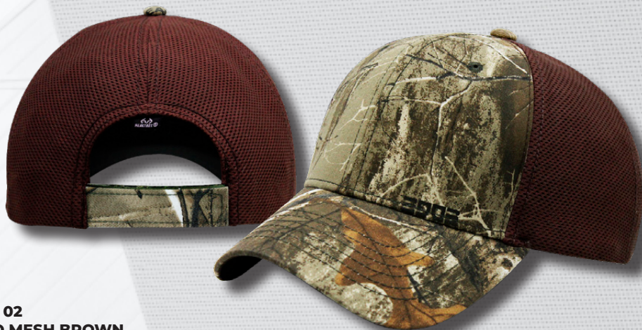
EDGE 02 CAMO MESH BROWN