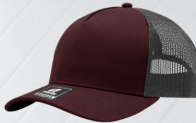
WINE / OXFORD