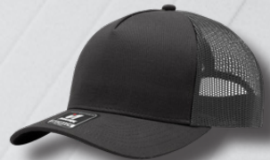
CHARCOAL / OXFORD