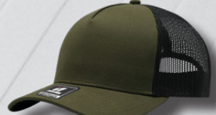
OLIVE / BLACK