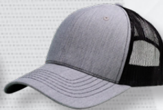
HEATHER GREY/ BLACK