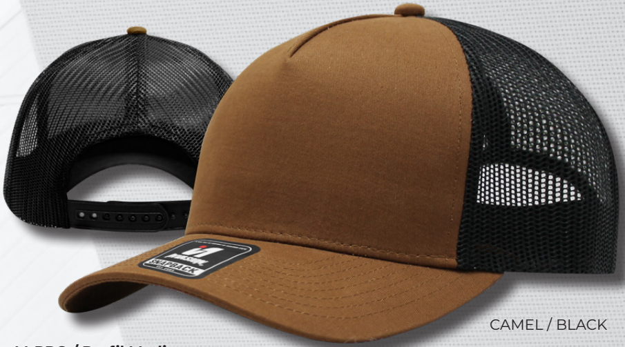
CAMEL / BLACK