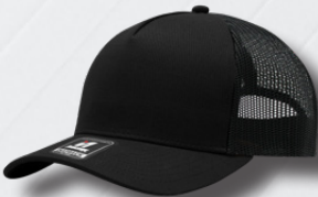
BLACK / BLACK